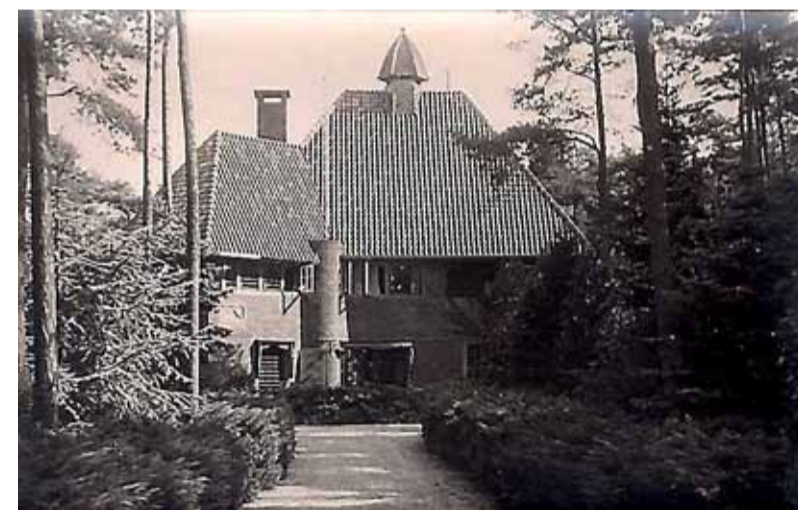
Villa 'De Craaihof' in Blaricum.